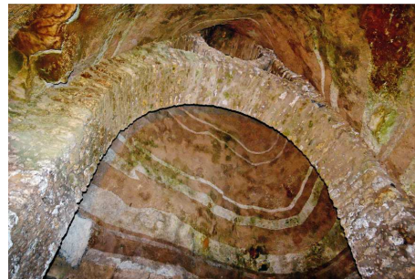
4- Cloche de fontis aux Catacombes