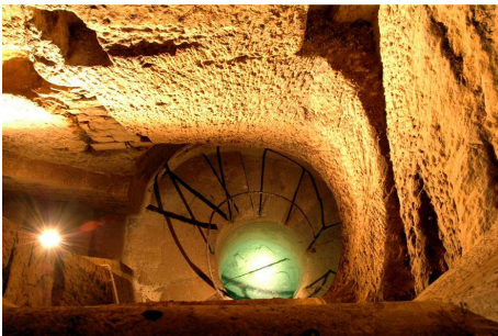
3- Bain de pieds des carriers