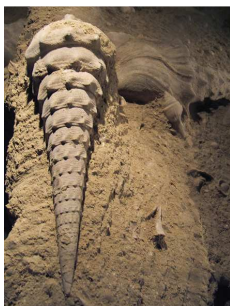
9- Le grand campanile, Campanile giganteum