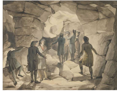
2- La visite aux Catacombes Aquarelle, 1804 – 1814 Paris, musée Carnavalet