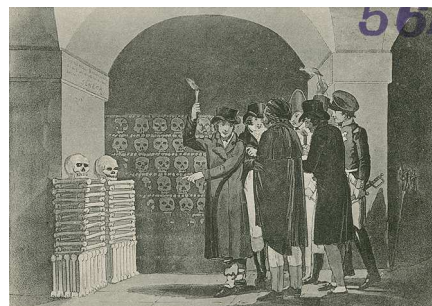
6- Visite aux Catacombes Reproduction d'une gravure anglaise, 1822 Carte postale, vers 1900. Paris, collection Roger-Viollet © Neurdein / Roger-Viollet