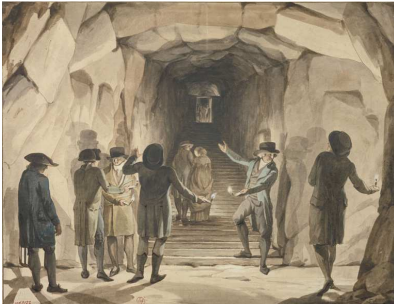
1- La visite aux Catacombes Aquarelle, 1804 – 1814 Paris, musée Carnavalet

Michèle Margueron (responsable du service communication/presse) / michele.margueron@paris.fr / tél. : +33 (0)1 44 59 58 38