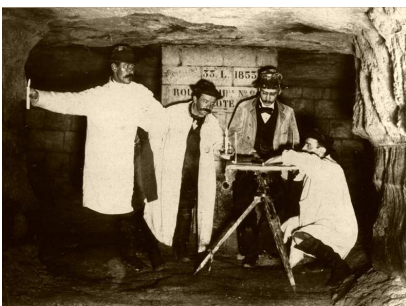
5- Intervention de géomètres dans les carrières de Paris au début du XXe siècle