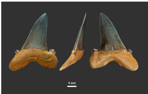
7- Dents du requin Squalotamia macrota