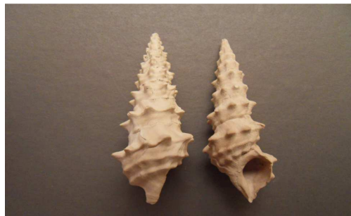
8- Cérithes dégagés d'un calcaire tendre des environs de Versailles